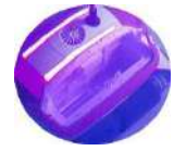
COPERCHIO CON ILLUMINAZIONE A LED