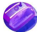
COPERCHIO CON ILLUMINAZIONE A LED