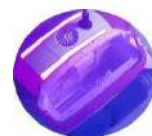
COPERCHIO CON ILLUMINAZIONE A LED